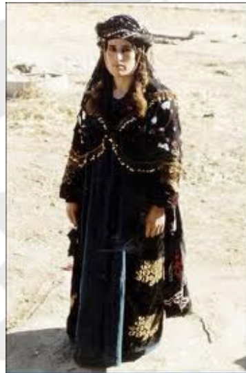
شکل ۳- لباس زن کرمانشاهی [۶].