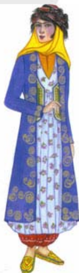
شکل ۱- اجزای اصلی پوشاک زنان کرمانشاهی [۵]

لباس زنان کرمانشاه شامل نه قسمت اصلی است که در ادامه به معرفی آن‌ها پرداخته شده است، اجزای اصلی این لباس در شکل ۱ مشاهده می‌شود.