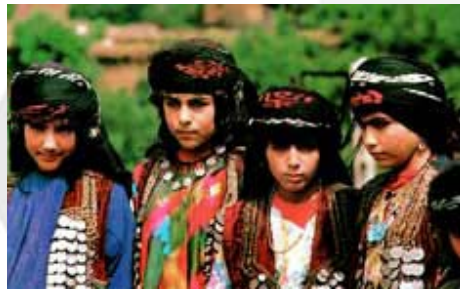
شکل ۲- سربند زنان کرد کرمانشاه.

سربند زنان گرد این استان، پر پشت است و از چندین دستمال بزرگ کلاغی ریشه دار تشکیل شده است. این دستمالها را معمولاً بر دوره کلاهکی که گاه شبیه عرق چین است می پیچند پس از این که موی سر را شانه زدند و به دو بر صورت رها کردند و سربند اول را بستند، کلاغی های دیگر را بر رو، و اطراف آن به صورت رها تر می پیچند و دنباله ای نیز از آن بر پشت سر می آویزند. در این سربند، آخرین و رویی ترین دستمال کلاغی را چنان ترتیب می دهند که ریشه های آن به وضع مطلوبی در جلو و پیرامون سر، جلوه گری کند [۴]. گاه نیز بانوان ساکن مناطق کرمانشاهان و کردستان، به ویژه دختران و نوجوانان، به جای سربند، از کلاهک یا عرقچین منجوق دوزی شده ای استفاده می کنند که پوشش مناسبی برای دوختن زر و زیور و یا سکه آرائی است (شکل ۲) [۴].