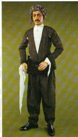
شکل ۵- پوشاک مردان کرد کرمانشاه [۵]

پیراهن‌های مردان سننوسه دارد، مگر برخی مواقع که به جای سننوسه، دستمالی به دور آستین می‌بندند. یقه آنها گرد است و جادکمه را گاه در پهلوئی گردن و گاه نیز در جلوی آن تعبیه می‌کنند. قد پیراهن، معمولی است. سننوسه‌های آستین، در پیراهن مردان نیز به دو شکل تهپیه و دوخته می‌شود: نوعی سننوسه‌اش مانند پیراهن بانوان کردستان است که از وسط قد آستین شروع می‌شود. نوع دیگر، سننوسه‌اش بلافاصله از زیر بغل آستین آغاز می‌گردد، در اولی، قد سننوسه بلندتر از پیراهن است. در دومی کوتاه می‌باشد و هم قد پیراهن است. کرواسی فقیانه، نوعی پیراهن است که داری آستین‌های بلند بوده و آستین‌ها به فقیانه معروف می‌باشد [۴].