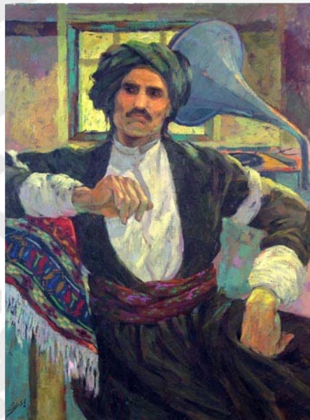
شکل ۶- پوشاک مردان کرد [۸].

کت شکلی ساده دارد. بره‌های آن راست به پایین بُرش گرفته است. بر روی لبه‌های کت، از حدود کمر به بالا تا حوالی پشت گردن چرخ‌دوزی می‌شود. دوپهلوی، پشت و دم آستین کت را چاک می‌دهند [۴].