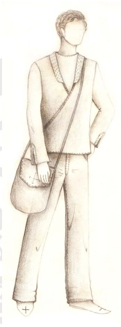
شکل ۸- طرحی ترسیمی برگرفته از پوشاک قوم کرد؛ در این طرح نواردوزی‌های پیراهن و طرح آستین برگرفته از لباس مردان کرد [ترسیمی].