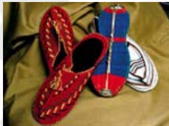
شکل ۴- نمونه‌هایی از پاپوش‌های کرمانشاهی [۷]

امروز بانوان کرد به کفش‌های شهری گرایش پیدا کرده‌اند ولی پاپوش معمول و بومی زنان کرمانشاهان همان کفش دست‌باف رنگین است که به گیوه کرمانشاهی مشهور است (شکل ۴) [۴].